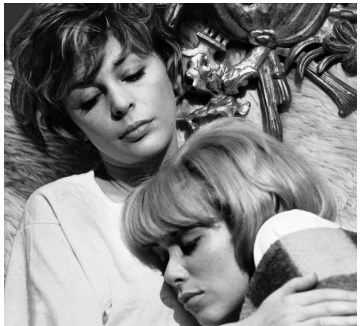
1966 GALIA de Georges Lautner avec Mireille Darc