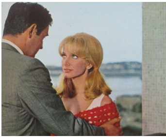
1966 VIA MACAO de Jean Leduc avec Roger Hanin