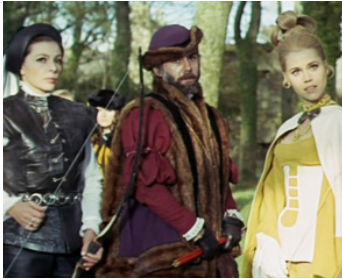
1968 HISTOIRES EXTRAORDINAIRES de Roger Vadim Metzengerstein avec Jane Fonda