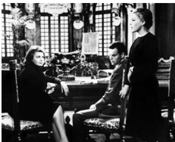
1962 LES SÉQUESTRÉS D'ALTONA de Vittorio De Sica avec Sophia Loren, Maximilian Schell