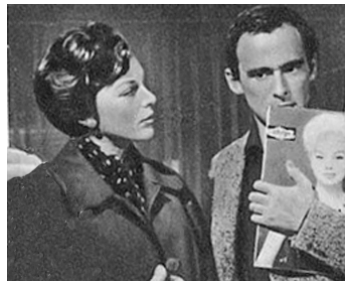
1958 CETTE NUIT-LÀ de Maurice Cazeneuve avec Maurice Ronet