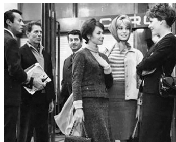
1963 VACANCES PORTUGAISES de Pierre Kast avec M. Auclair, D. Gélin, F. Arnoul, F. Brion