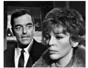
1967 L'ESPACE D'UNE NUIT de Philippe Laik avec Howard Vernon