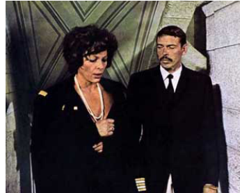
1970 MONT-DRAGON de Jean Valère avec Jacques Brel