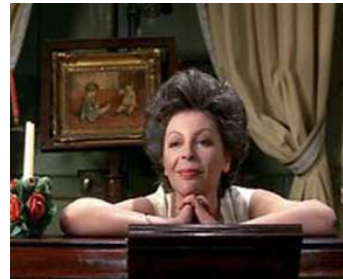
1975 MAIS OÙ SONT PASSÉES LES JEUNES FILLES EN FLEUR ? de Jean Desvilles