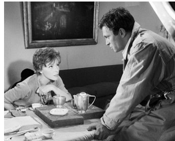
1962 IL MARE (Il Mare) de Giuseppe Patroni Griffi avec Umberto Orsini