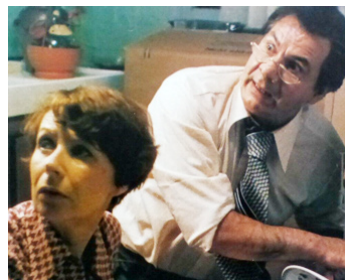
1977 L'AMOUR EN HERBE de Roger Andrieux avec Michel Galabru