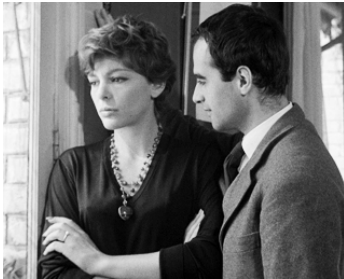
1961 PARIS NOUS APPARTIENT de Jacques Rivette avec Gianni Esposito