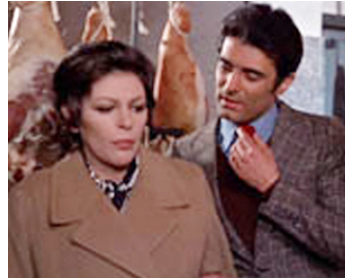
1973 SENSUALITA (Quando l'amore è sensualità) de Vittorio De Sisti avec Gianni Macchia