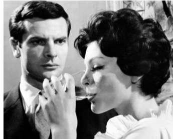
1961 LA FILLE AUX YEUX D'OR de Jean-Gabriel Albicocco avec Paul Guers