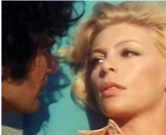
1969 POURQUOI PAS TOI ? (Brucchia ragazzo, brucchia) de Fernando Di Leo avec G. Macchia