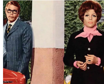
1970 UN JOLI CORPS QU'IL FAUT TUER d'Alfonso Brescia avec George Ardisson