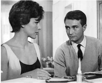
1960 LE BEL ÂGE de Pierre Kast avec Hubert Noël