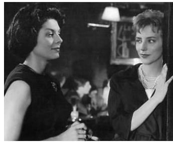
1959 MERCI NATERCIA de Pierre Kast avec Clara d'Ovar