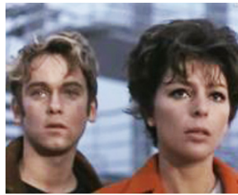
1966 MAIGRET FAIT MOUCHE (Maigret und sein größter Fall) d'A. Weidemann avec Ulli Lommel