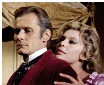
1965 LES NUITS DE L'ÉPOUVANTE (La Lama nel corpo) de M. Hamilton avec William Berger