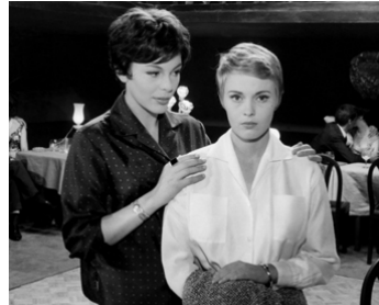
1961 LES GRANDES PERSONNES de Jean Valère avec Jean Seberg