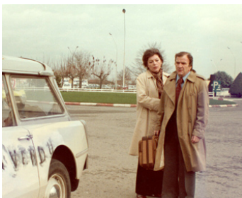
1976 LE TÉPHONE ROSE d'Édouard Molinaro avec Pierre Mondy