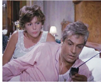
1968 LES RUSSES NE BOIRONT PAS DE COCA-COLA de Luigi Comencini avec Nino Manfredi