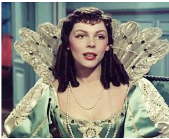
1953 LES TROIS MOUSQUETAIRES d'André Hunebelle