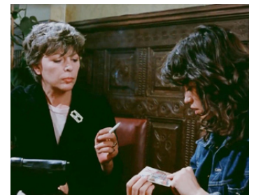
1981 MERRY-GO-ROUND de Jacques Rivette avec Maria Schneider