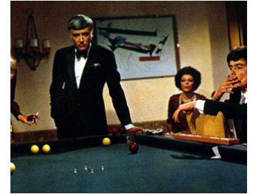
1969 LA LIMITE DU PÉCHÉ (Quarta Parete) d'Adriano Bolzoni avec Peter Lawford