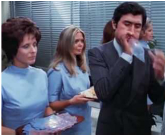
1971 LE PDG A DES RATÉS (La prima notte del dottore Danieli) de G. Grimaldi avec L. Buzzanca