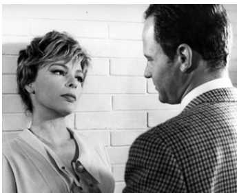
1963 AMOUR SANS LENDEMAIN (Un tentativo sentimentale) de P. Festa Campanile avec J-M. Bory