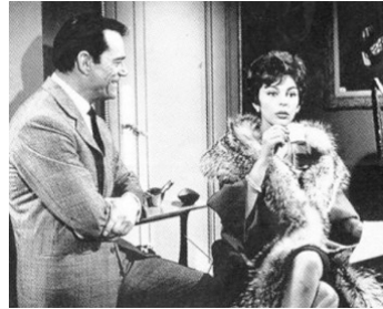
1960 COMMENT QU'ELLE EST ? de Bernard Borderie avec Eddie Constantine