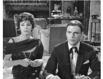
1961 LE JEU DE LA VÉRITÉ de Robert Hossein avec Jean-Louis Trintignant