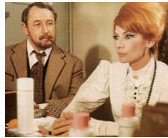
1967 L'UNE ET L'AUTRE de René Allio avec Philippe Noiret